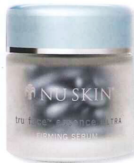
Tru Face Essence Ultra RM688/ Nu Skin

Longines诚意推出Conquest Classic（征服者）全新腕表系列，该设计诠释了品牌的优雅、经典及卓越性能，特别选用自动上链机芯，完美展现隽永风范。部分女装款式外圈镶嵌30颗钻石，珍珠贝母表面上也镶有12颗钻石刻度，彰显高贵气质。整个系列的防水深度高达50m，配以旋入式蓝宝石水晶表背，绝对值得收藏~