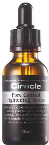
Ciracle Pore Control Tightening Serum精华液可有效帮助紧致及细化毛孔。

全新Ciracle Pore Control Tightening Serum毛孔紧致精华液蕴含天然有机植物萃取精华，可帮助紧致及细化粗大毛孔，消除肌肤老废角质，打造漂亮美肌。产品独特配方含有甘菊和金缕梅天然萃取精华，可帮助舒缓肌肤，肌肤光泽度及柔滑度UP！