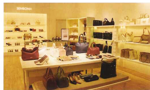
SEMBONIA旗舰店集合多款包包、鞋子、钱包等饰品。

为了迎接阳光明媚的季节，改变郁闷的工作心情，BIEM最新系列以「Living Colours」为主题，采用缤纷及抢眼的色彩，鼓励现代男人们混搭风穿搭方式，以非传统及大胆的态度展现自己。此系列服饰风格优雅中带有趣味，运用性感的雪纺并混合棉质，让女性展现女人味又不失精致。