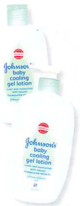
Johnson's® baby全新清凉润肤露分别有200ml和500ml瓶装，价格为RM10.90及RM20.90。

游戏时间是其中一个促进亲子关系的珍贵时光，别让马来西亚酷热的天气阻止你与孩子到户外嬉戏和享受天伦之乐！Johnson's® Baby如今借着Baby Cooling Gel Lotion解救你的困扰。独特水润质地的乳液非常轻盈易渗透，同时也让你和孩子的肌肤全天候享有冰凉清新的感觉。此外，配方中也蕴含能够镇静肌肤的天然金银花提取物。高渗透力的特点，使肌肤迅速呈现柔滑、滋润的丝质触感。这些特点都将确保妈妈和孩子之间的肌肤触碰时，感觉清新舒适。不粘腻和不轻柔的质感会让你和你的孩子在户外嬉戏时一直保持好心情！