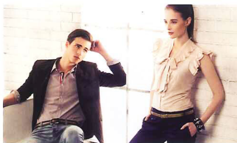
BIEM全新系列可于AEON Cheras Selatan, KL Festival City及AEON Tebrau City的Outfitters Studio里购得，亦在百Parkson, Pacific, The Store及Sogo等各大商场设有专柜。